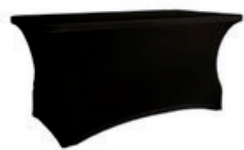
Pokrowiec elastyczny cateringowy czarny