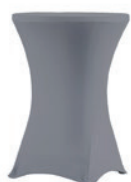
Pokrowiec elastyczny koktajlowy szary