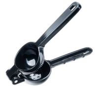
Wyciskacz do cytrusów