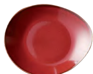
Talerz płaski czerwony