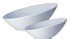
Misa asymetryczna biała melamina

68A426EL589 ø 380 mm H 175 mm 68A426EL588 ø 300 mm H 140 mm