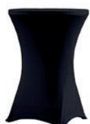
Pokrowiec elastyczny koktajlowy czarny