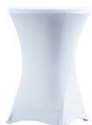
Pokrowiec elastyczny koktajlowy biały