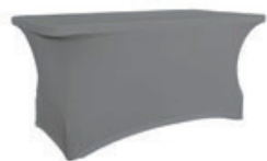
Pokrowiec elastyczny cateringowy szary