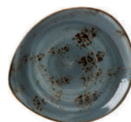
Talerz głęboki craft