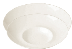
Talerz gourmet głęboki

FDGD29 ø 290 mm H 60 mm FDGD26 ø 260 mm H 60 mm