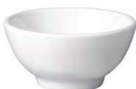
Biała okrągła miska pure