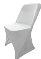
Pokrowiec elastyczny na krzesło