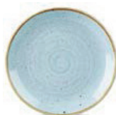
Talerz płaski organic