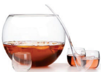
Waza do ponczu