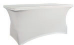
Pokrowiec elastyczny cateringowy biały