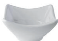
Biała miska mini