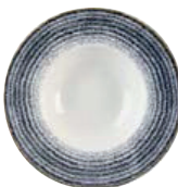
Talerz głęboki z szerokim rantem