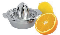
Wyciskacz do cytrusów